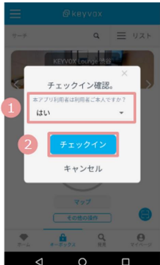
④施設の利用本人かを選択し「チェックイン」をクリック