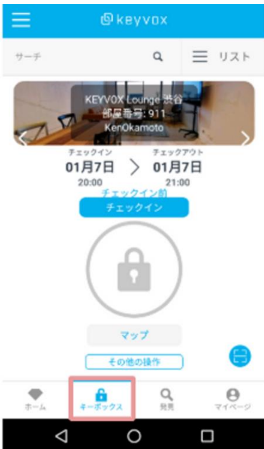
①予約サイト、アプリの下部キーボックスをクリック