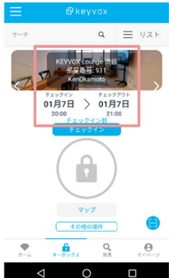
②予約済みの内容が表示されます